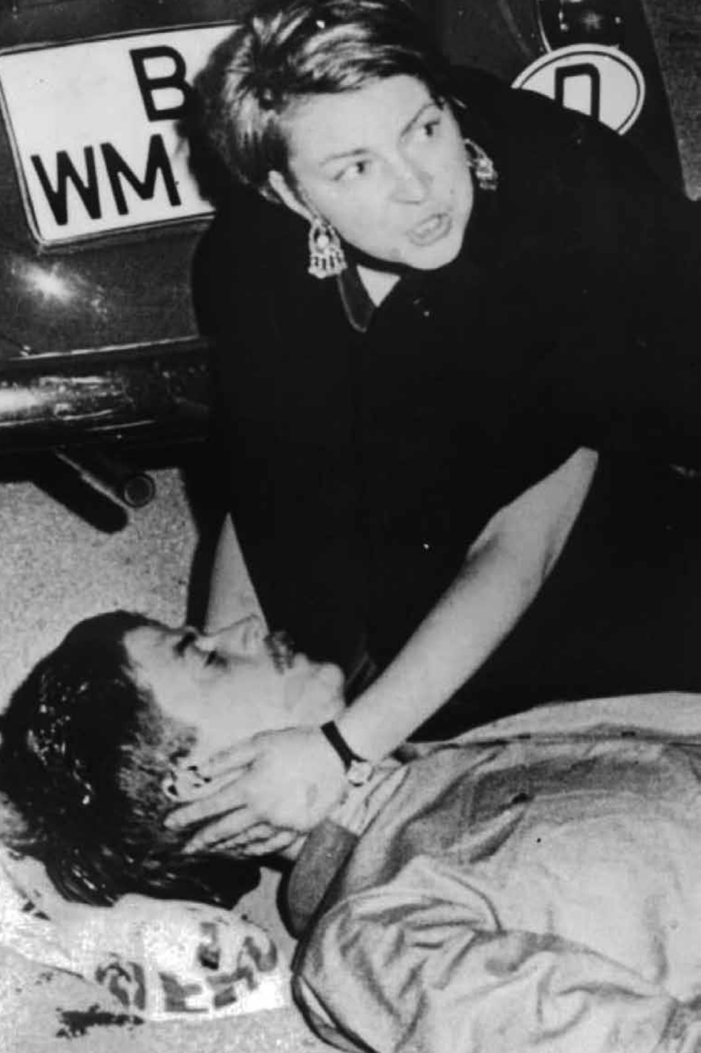
Benno Ohnesorg, en el suelo, tras recibir un balazo del policía Kurras en el curso de una manifestación contra la visita del sha de Persia el 2 de junio de 1967

La entrevista sobre las condiciones en que se formó el «Movimiento 2 de Junio» se llevó a cabo el 22 de noviembre de 1992 en Berlín-Neukölln, en el marco de una exposición.