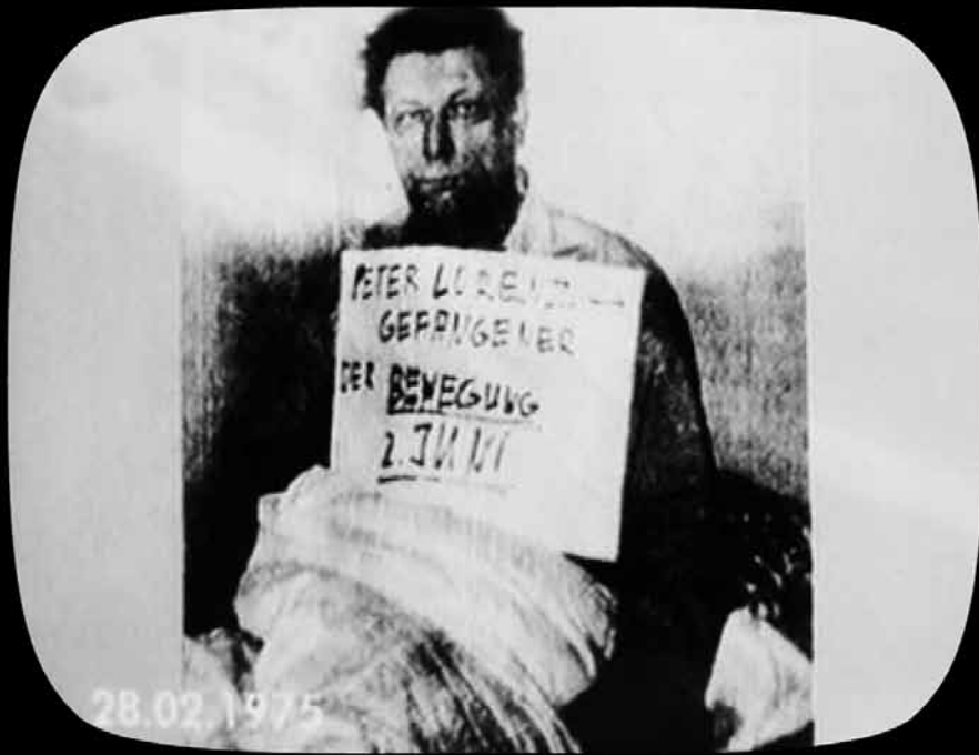
El dirigente democristiano secuestrado. En el cartel: «Peter Lorenz, prisionero del Movimiento 2 de Junio»