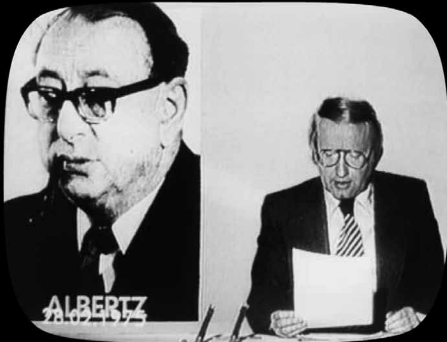
Telenoticias alemán con la foto de Heinrich Albertz, sacerdote y ex alcalde de Berlín que intermedió en el secuestro

El jueves 27 de febrero de 1975, sobre las 9:00 horas, en el Quermatenweg de Berlín unos desconocidos pararon el coche oficial de Peter Lorenz, presidente regional de la Unión Cristiano-Demócrata (CDU). Peter Lorenz pasará los siguientes cinco días y medio en la «prisión popular» del Movimiento 2 de Junio. A cambio de Lorenz, dos manifestantes detenidos salen en libertad y cinco presos pertenecientes a varios grupos guerrilleros de Alemania Occidental son transportados en avión a la República Popular del Yemen. Veinte años después, el diario berlinés Junge Welt publicó una serie de entrevistas en la que dos de los participantes relatan los acontecimientos. El secuestro de Lorenz fue así como un hito en la historia de la izquierda radical alemana: el primer y único secuestro de un político que hizo posible la liberación de unos compañeros encarcelados.